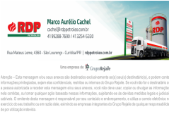
image001.png 124 KB